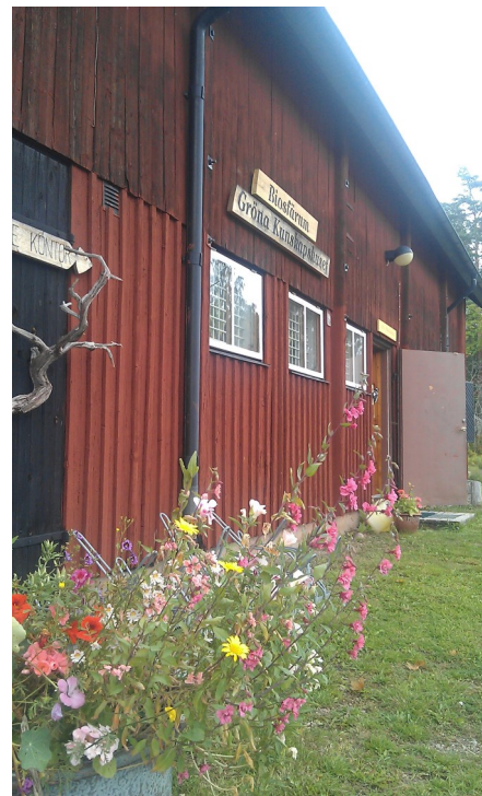
Biosfärums, Gröna kunskapshuset.

Färden fortsatte mot Östa Camping där vi åt middag tillsammans med ambassadörerna från Nedre Dalälven och fortsatte våra diskussioner om hur vi kan samarbeta i framtiden. Vi fortsatte sedan till vårt vandrarhem där vi skulle bo över natten.