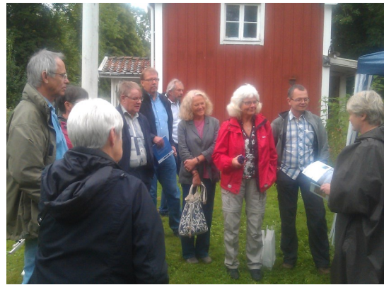
Röttle by vid kvarnen och slutdiskussion.