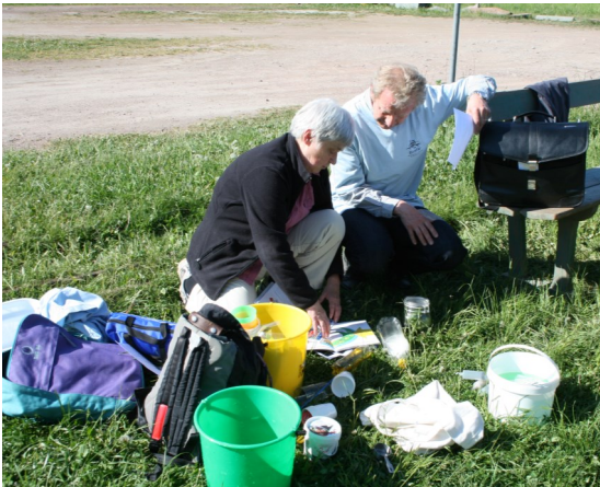
Fixande inför barnens ankomst.

Vi hade förberett sju stationer med olika teman där barnen skulle uppleva eller lära sig olika saker. Stationerna hade följande teman: Geologi i Kinnekulle och visning av stenhuggeriet, biosfären, luft och vatten, träd och blommor, småkryp, fåglar och fiskar.