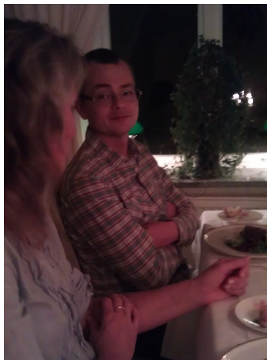
Boendet Kastanjelund där vi sov över natt samt åt middag på kvällen.

Nästa dag åkte vi en rundtur i Vattenriket på Helge Å. Vattnet och dess betydelse är det som ligger till grund för Biosfärområdets bildande. En entreprenör certifierad av Naturens bästa guidade oss i området och berättade om vattnets betydelse för området.