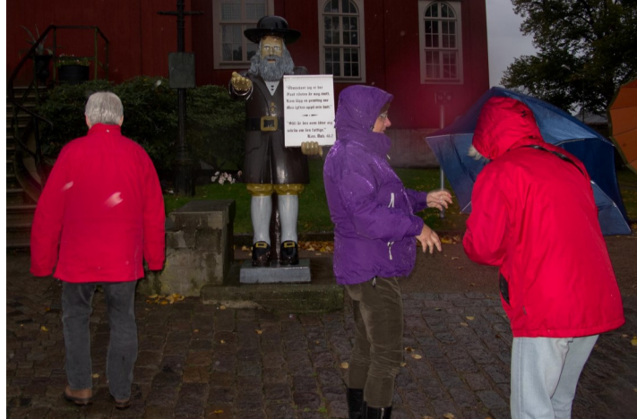
Fika i Ronneby och regnig promenad i Karlskrona.

Boendet var nybyggt och finansierat genom ett Leaderprojekt. Det hade anknnytning till den sportfiskeverksamhet som fanns där med butik och restaurang. Dag tre åkte vi mot Göholms Gods på Göhalvön där vi fick höra historien om godset samt dess natur och kulturhistoria runt omkring. Nystartade entreprenörer hade i anslutning till herrgården startat ett vandrarhem som berättade om sin verksamhet.