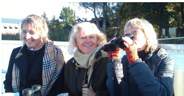
Guidad tur på Helge å.