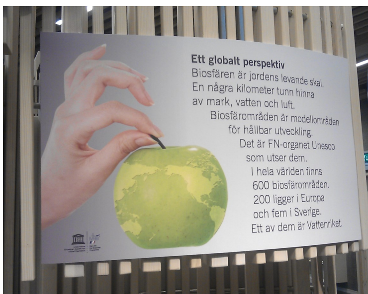
Ordföranden från Vattenrikets vänner berättar om deras funktion samt planer på att deras medlemmar ska bli deras biosfärområdes ambassadörer.