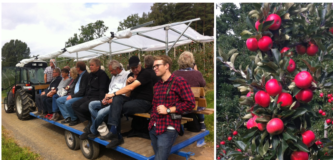
Äpplesafari mellan äppleträden