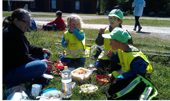
Lunchpaus med grillad korv.