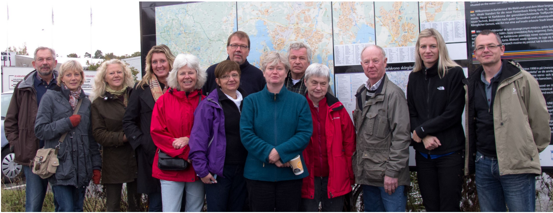
Samtliga deltagare från första studieresan till Kristianstad Vattenrike samt Blekinge arkipelag.