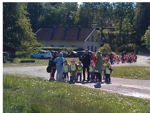
Alla barnen kommer till Råbäcks mekaniska stenhuggeri.