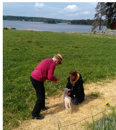
Besök på Bengtsgården där de bedriver sportfiskeverksamhet

Vi fortsatte mot Humlebackens kulturhus där vi fick fika och lyssna på "kulning". Kulturhuset driv av ideella krafter och arrangerar kulturarrangemang i bygden. Därefter besökte vi Karlfeldtsgården i Karlbo där vi åt Lunch och fick en guidad tur.