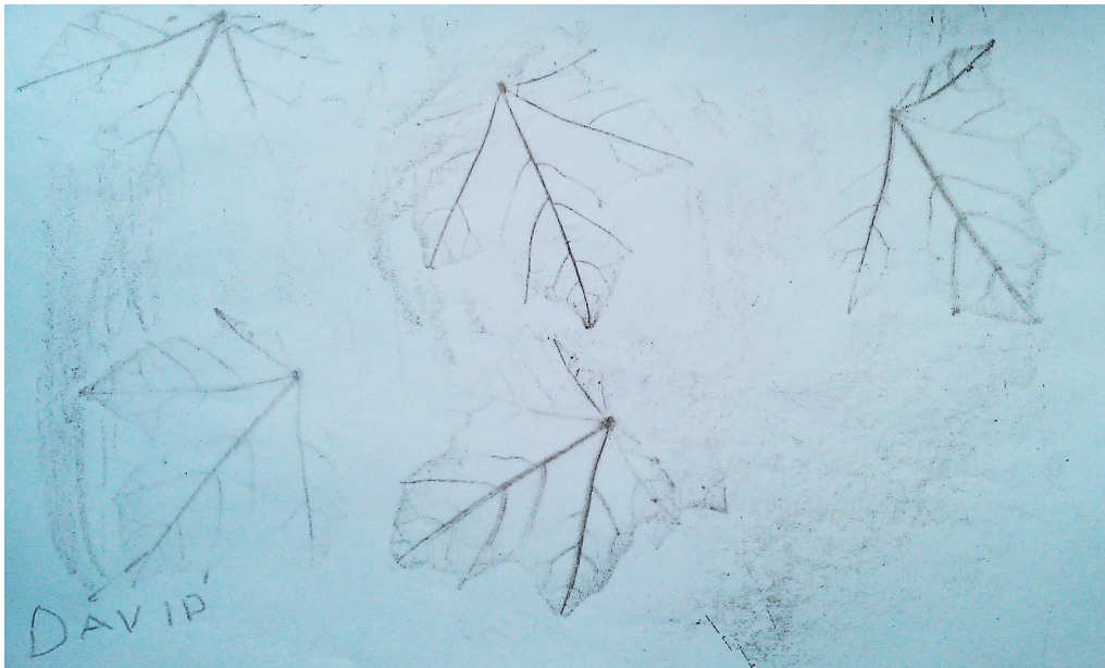
Vid en station målade barnen av löv. Här en teckning av David.

När barnen ätit lunch och genomfört alla aktiviteter samlades de och utnämndes till Miniambassadörer. De fick var sitt diplom och en pin med Biosfärloggan på. Detta visade sig vara mycket uppskattat.