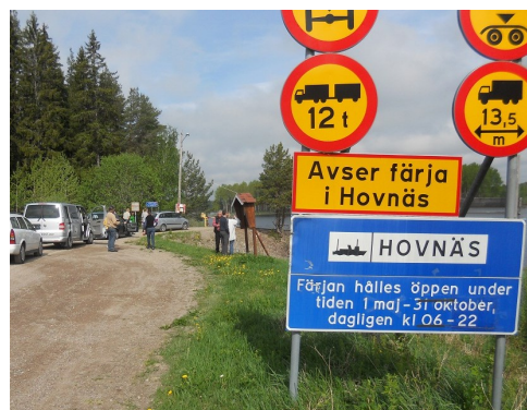
Färja över Nedre Dalälven.

Dag två fortsatte vi västerut via färja över Dalälven till Bengtsgård som en av ambassadörerna drev. De berättade om sin verksamhet om att hyra ut boende och båt till sportfiskare från Polen.