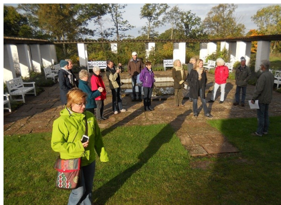
Nybyggt boende i Sandhamn där vi övernattade i sjöbodarna samt besök på Göholms Gods.