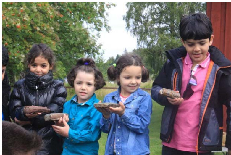
Foto: Under en dag i Råbäck fickasylsökande barn lära om geologi projektet Miniambassadörer som delfinansierats av GULLD-fonden.