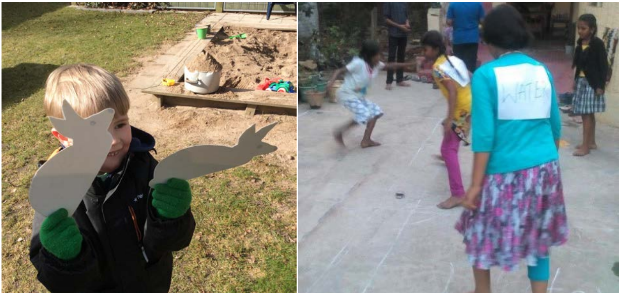
Foto. Totalt 28 olika lekar skapades i 2016 års Biosfärutmaning. Skolklasser från både vårt eget biosfärområde och andra deltog. "Hitta kaninerna" -Filsbäcks förskola (tv) och "Falli" från Achanakmar Amarkantak Biosphere Reserve i Indien (th) är några av lekarna som togs fram till utmaningen.