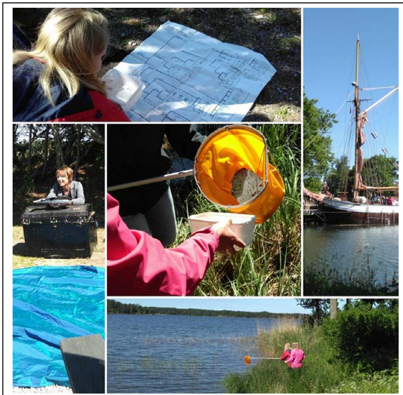
Inspirationsdagen i Sjötorp för pedagoger i förskolan blev lyckad. Deltagarna fick prova på olika aktiviteter som kan genomföras med barnen under en utbildning med miniambassadörer.

Sedan 2012 har drygt 200 miniambassadörer utbildats. Vi har sökt medel för att utveckla miniambassadörverksamheten under 2017 och har beviljats 45 000kr genom John Hedins Stiftelse.