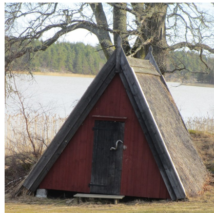
Exempel på hur en krake kan se ut

Avsikten med förslaget är att skapa förutsättningar att utveckla kanotturism genom att möjliggöra enkla övernattningsställen av typen krake (krakar är enkla hyddor av typen täkt vindskydd, inredda med enkla britsar och låsbar dörr, som utformas utifrån lokal tradition på Kållandsö) eller vindskydd. Tanken med krakar är att de möjliggör bokning mot betalning och därmed kan bidra till att ge kommersiellt underlag som kan säkerställa driften, och att öka områdets attraktionskraft för turism, eftersom det möjliggör att sälja paddlingspaket med förbokad övernattningsalternativ, är tänkt att svara för drift och tillsyn av övernattningsplatserna och ta hand om intäkterna som ett sätt att täcka sina kostnader för detta.