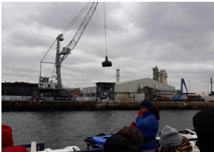
Pågående arbete i Dublin Port under guidad tur

Under studiebesöket till Dublin Port fick vi en guidning av hamnområdet och information om hamnens miljö- och hållbarhetsarbete. Dublin Port är certifierat enligt ISO14001 och arbetar därmed efter vissa riktlinjer när det gäller exempelvis luftkvalitet. En viktig del av deras hållbarhetsarbete handlar om bevarande av den biologiska mångfalden i området, som har ett rikt djurliv och säreget artbestånd. Samarbetet med aktörer för bevarande av det rika fågelbeståndet är något som Dublin Port är stolta över. Hamnområdet är relativt litet men har mer rörelse än de större hamnarna i t.ex. Storbritannien och Nederländerna. Under ett informationsmöte fick deltagarna ta del av de utmaningar och det ansvar som följer med att vara en stor och viktig samhällsfunktion – en tredjedel av produkterna i ett irländskt hem har gått via Dublin Port.